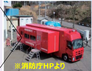
モニタリングシステム及び車載ユニット