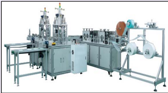
マスク生産設備（イメージ図）