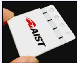
ウイルス検出用のチップ・デバイス