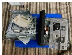
分解 鉄・プラ・アルミ