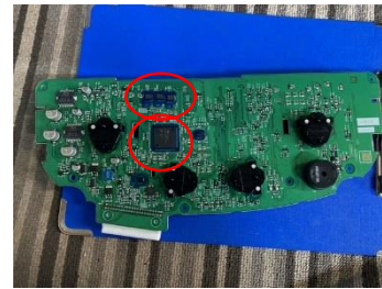
表面 正方形、長方形IC装着