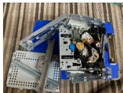
分解 鉄・プラ・アルミ