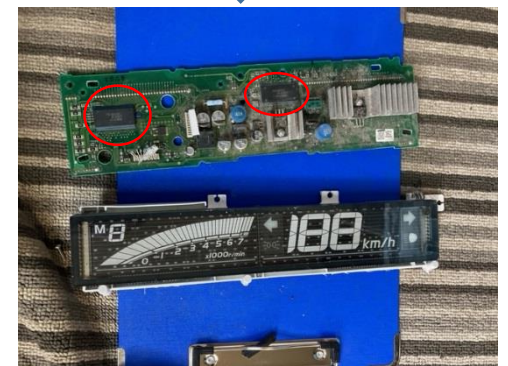
強引には有るが、基板分離可能。 表示部分は樹脂、ガラス製で重量が有る ため、必ず分離除去をする。