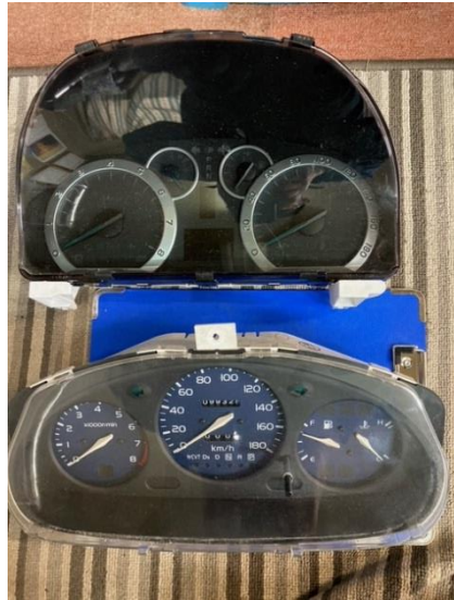
上 メーターユニット新 (トリップメーターデジタル式) 下 メーターユニット旧 (トリップメーター機械式)