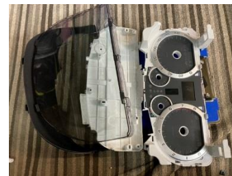
基板を取り出したケース(PP・PMMA類)