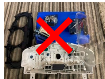
旧式メーターユニットは 基板装着無し×